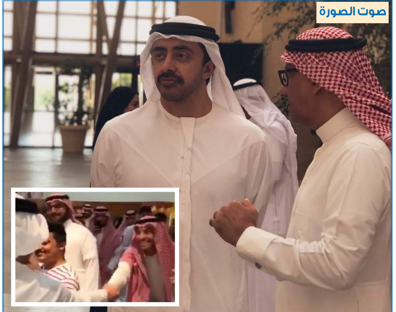
وزير خارجية الإمارات عبدالله بن زايد خلال زيارته للجامعة.. وفي الإطار دبلوماسي من طالب الفيزياء نواف الغدير يثير مواقع التواصل