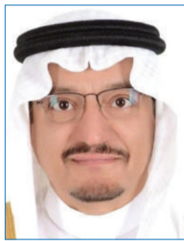
د. آل الشيخ

بشكل تدريجي على ثلاث جامعات كمرحلة أولى، ومنها مدة انتقالية لمدة «سنة» ابتداءً من تاريخ نفاذ مشروع النظام. وأضاف أن النظام الجديد يمتاز بتحقيق الاستقلالية المنضبطة للجامعات وفق السياسة العامة التي تقرها الدولة، وإنشاء مجلس